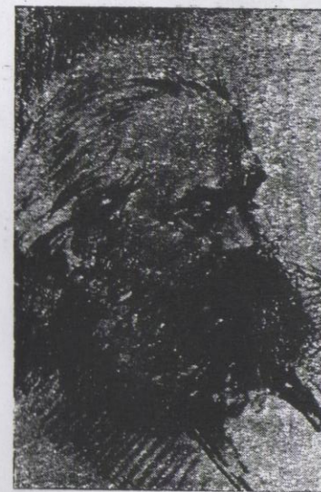
Carlos MARX (1818-1883). De él se dijo: "La doctrina de Marx es todopoderosa porque es verdadera".

Los pensadores se habían aproximado hacia ya mucho tiempo a la nueva concepción de la historia, a la concepción materia-